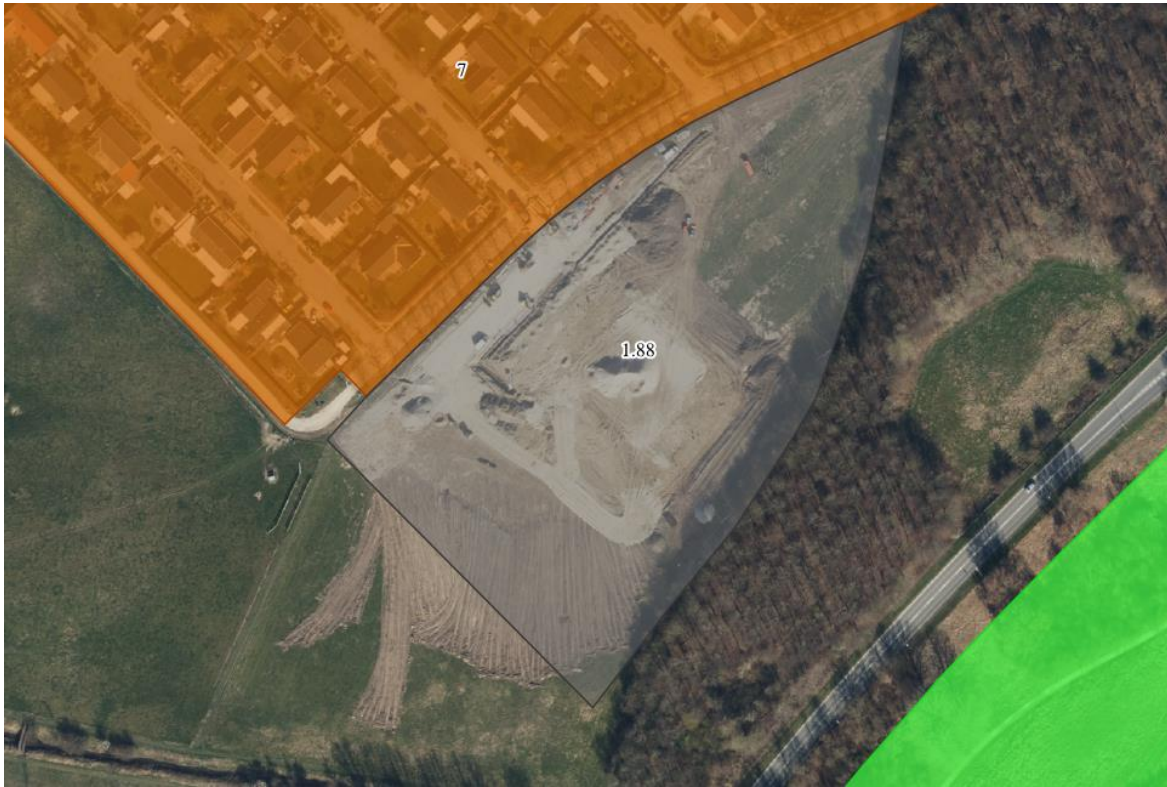
Billede 1: Området for kommuneplantillæg nr. 10 og lokalplan nr. 1.88 Ørnekers Vænge Syd.